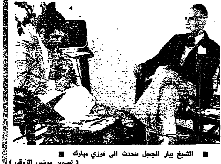
الشيخ بيار الجميل يتحدث الى فوزي مبارك

كثبت فوزي مبارك الشيخ بيار الجميل معروف بصحة وصرافته وقوته وإفلاحه لسراي الذي يدي ولقطة التي ينطق بها والتصريحات الهيمية التي يذلي بها رئيس الكتائب ، تملكت على الأحداث ، قد لا تكون كل مضامينها مقبولة عند جميع الأطراف ، لكنها تبقى مميزة عن حسن نية الرجل وعن مدى ما يماثيه ، وهو يحاول اتقاء الآخرين بما يبرهه حقا وصوابا .